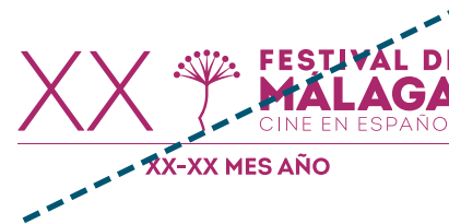
Aplicación incorrecta color